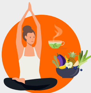
Sich um die eigene Gesundheit kümmern